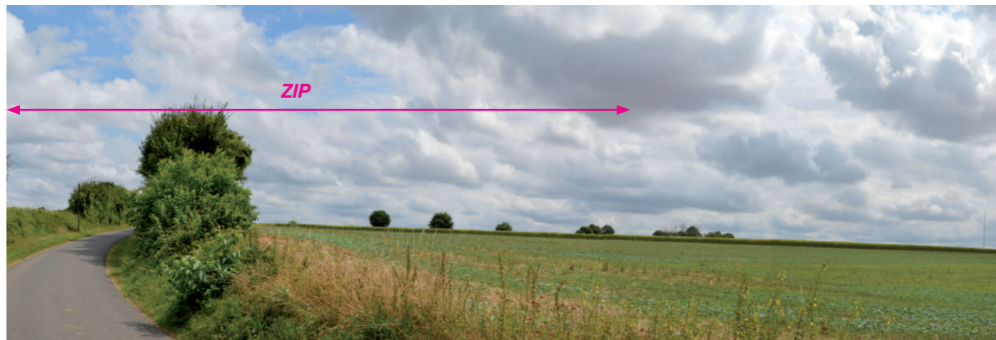
Photographie 74 : Covisibilité avec l'église de Chail en sortie nord du village