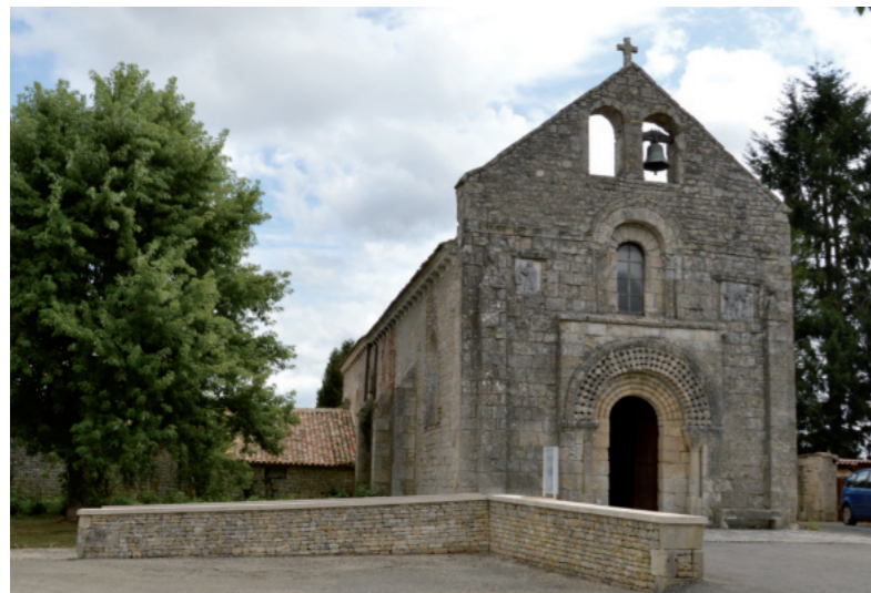
Photographie 72 : Eglise de Chail

Depuis le monument, aucune relation visuelle n'est identifiée en raison des masques bâtis et végétaux. Aux abords du village et notamment en sortie nord, aucun obstacle visuel ne masque la ZIP qui entre ainsi en covisibilité indirecte avec l'église. La sensibilité est modérée.