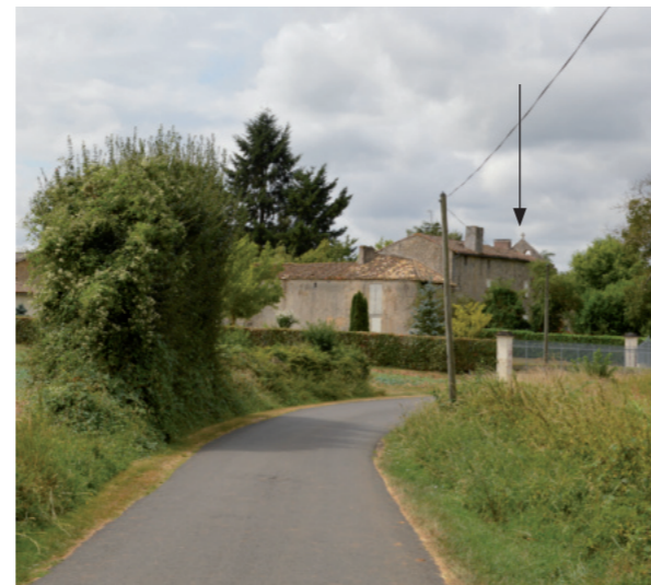
Photographie 73 : Visibilité limitée de l'église de Chail en sortie nord du village